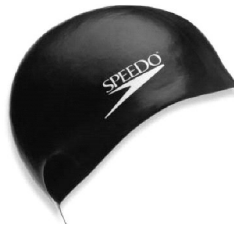
Speedo Plain Moulded Silicone

Ja, ik wil graag nieuwe polocap's en/of badmutsen bestellen.