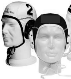
Waterfly waterpolocap Nylon

Hieronder staan de caps en de badmuts afgebeeld.